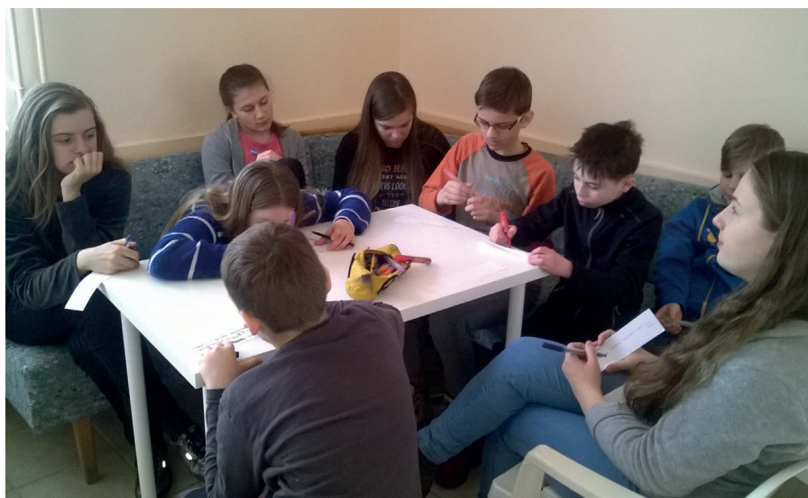
Kiscsoportos munka az ifis hétvégén