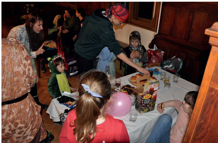
Kisebkek és nagyobbak mind jól szórakoztak a gyülekezeti farsangon