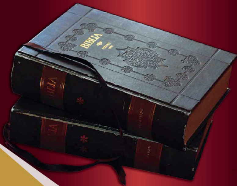
Vizsolyi Biblia (1590 - fcs. Vizsoly-Helikon 1981)

Gyülekezetünk 2018-as naptára az őszi Biblia-kiállítás anyagának felhasználásával készült