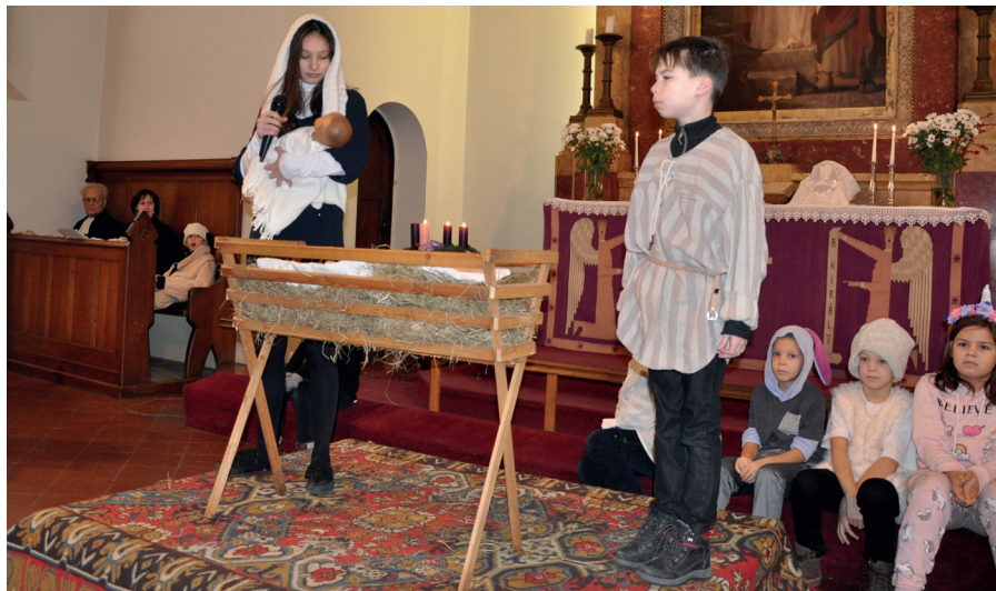
A gyerekek karácsonyi műsora közelebb hozta a karácsonyi történetet