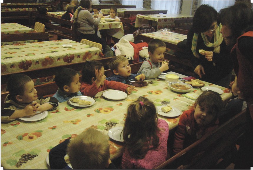
Reggeli a dévai ovisokkal