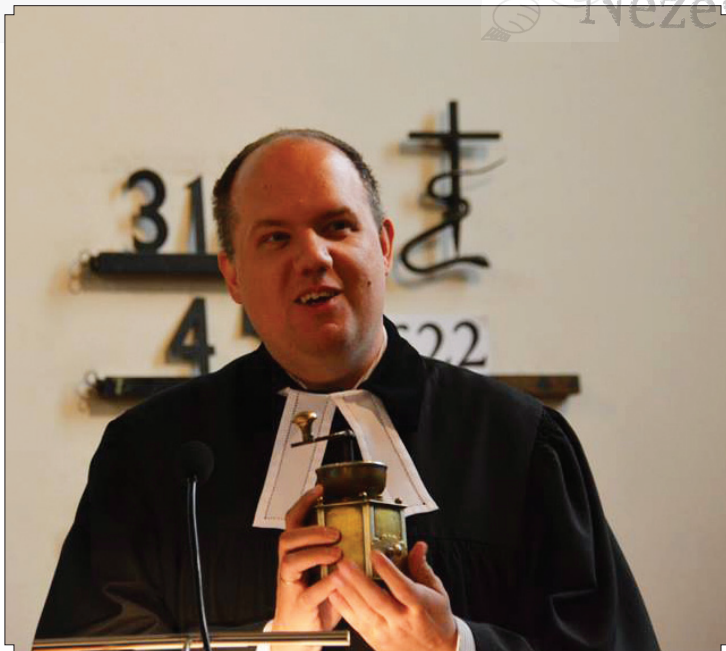
A hitvalló kávédaráló