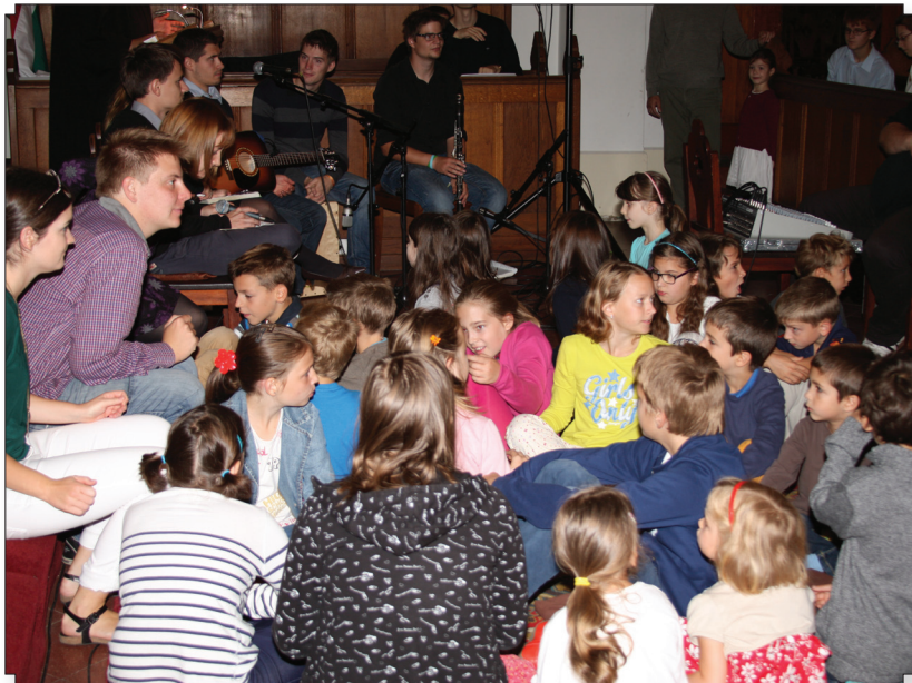
Gyereksereg a tanévnyitó családi istentiszteleten