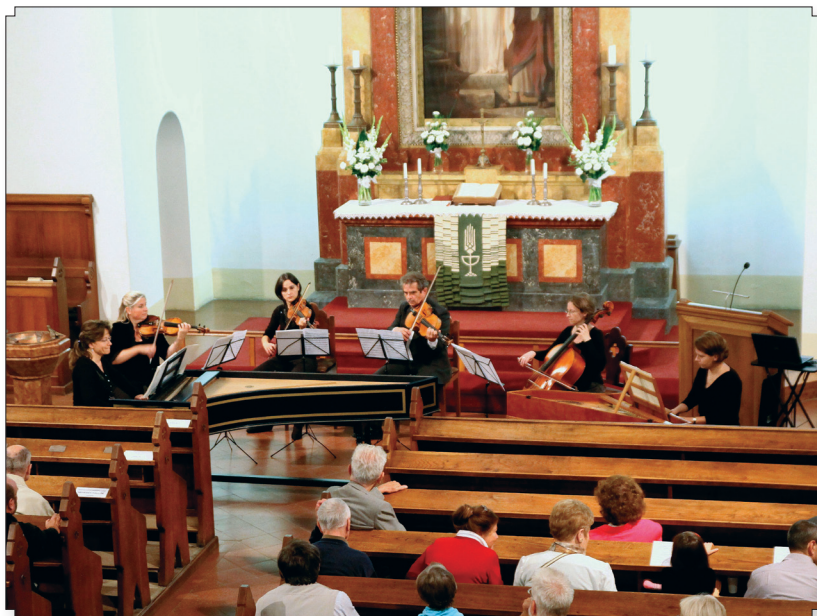
Bach-est a nyitott templomban