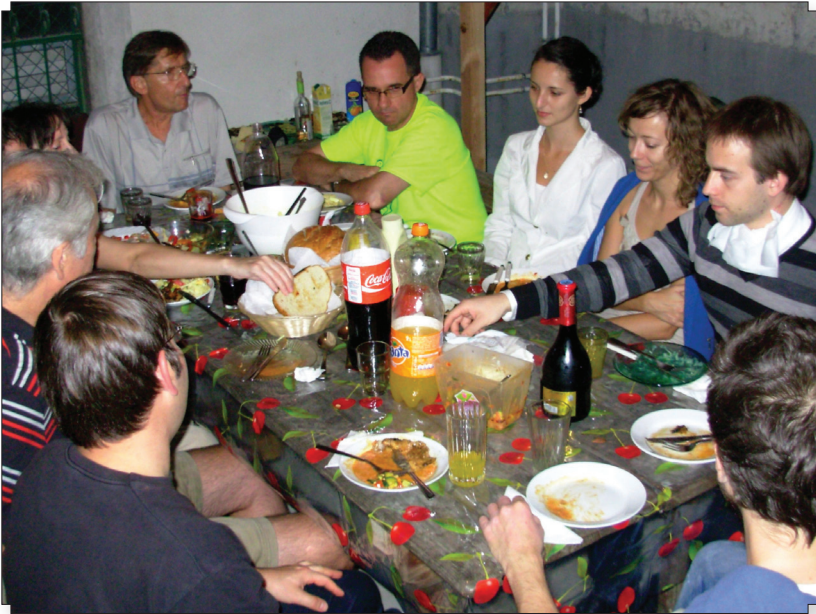
Fiatalfelnőttek évnnyitó alkalma