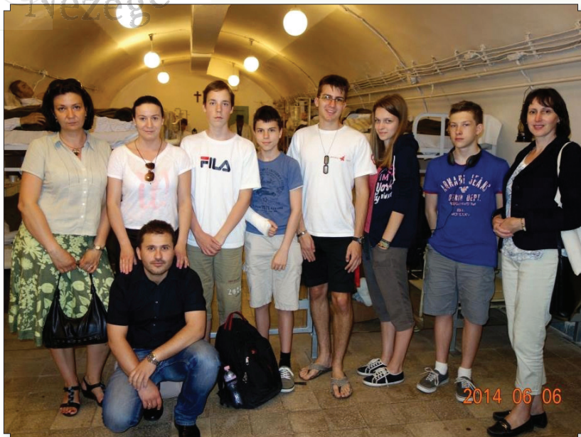
A kis ifi a Sziklakórházba látogatott