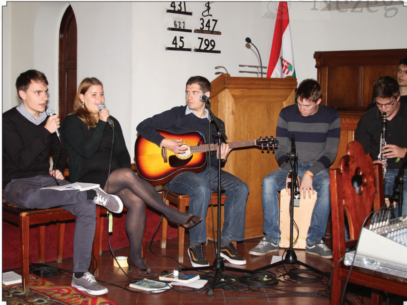
A „családin” a Közel zenekar szolgált