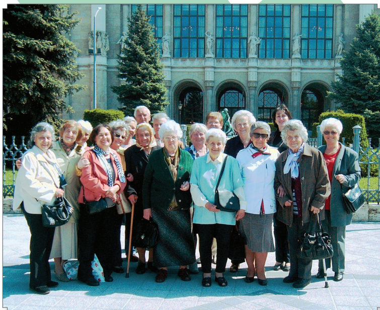
Kirándulás a székesfehérvári nyugdíjasokkal