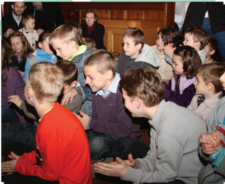
Vidámság a családi istentiszteleten