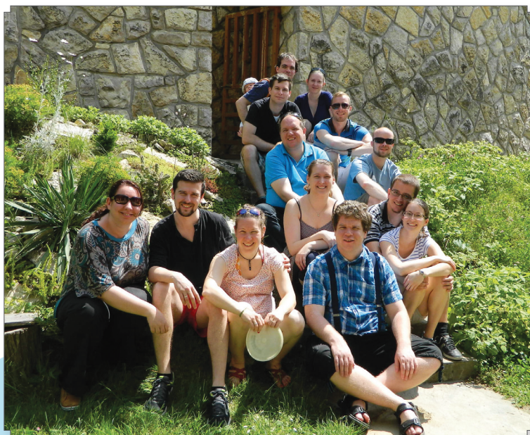
Balatonboglárra látogatott a szenior ifi