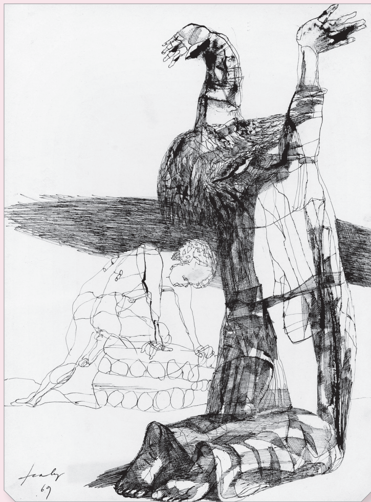
Szalay Lajos: Ábrahám áldozata (1969)

„Léttünk a kegyelem drámája.” (Pilinszky János)