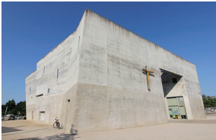
Freiburg – Mária Magdolna ökumenikus templom

a kelenföldi evangélikus gyülekezet tanácstermében