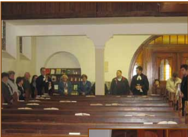
Reformációi úrvacsoraosztás szeretetkörben