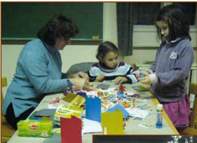
Készülnek a képeslapok