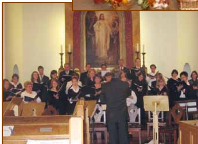
Hangverseny a művészetek estéjén