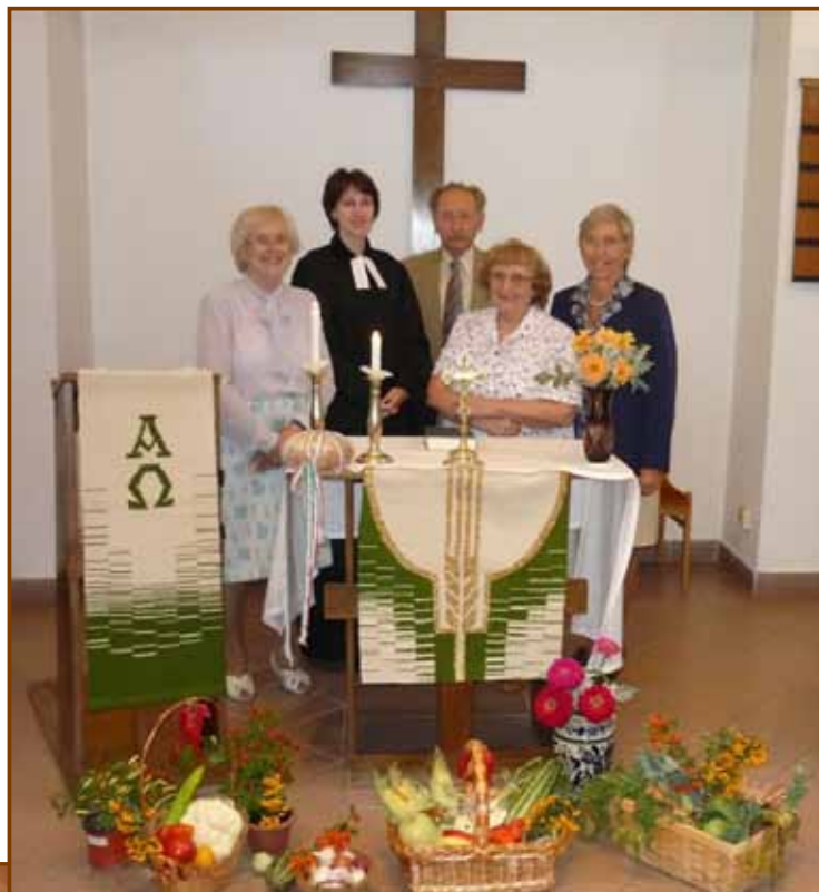
Szolgálattévők a farkasréti hálaadó istentiszteleten