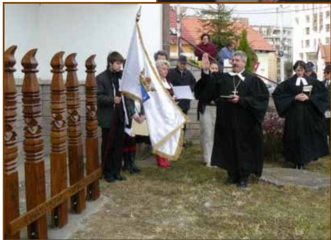
A kopjafák megáldása Sepsiszentgyörgyön