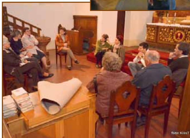
Kiscsoportos beszélgetés a gyülekezeti hétvégén