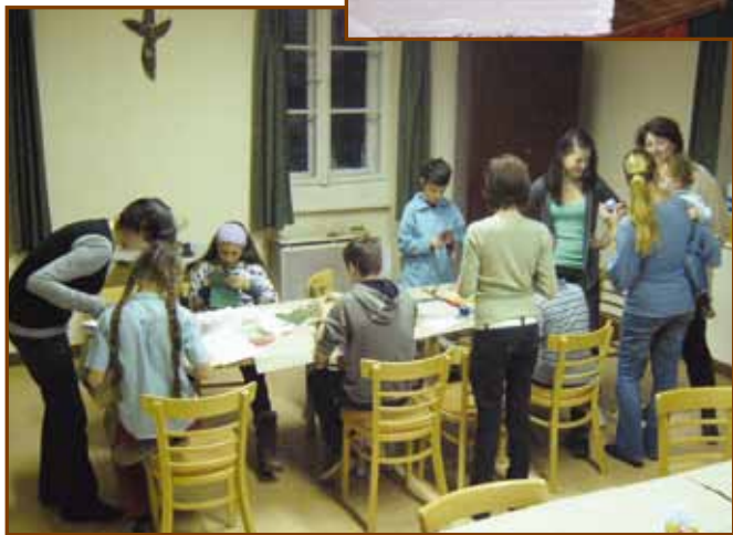
Ajándékkészítés az adventi délutánon