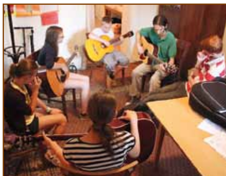
Gítáriskola a hittantáborban