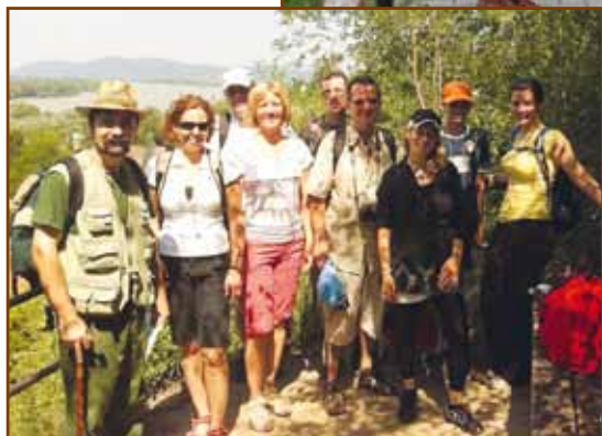
HÍFIsék a Dunakanyarban