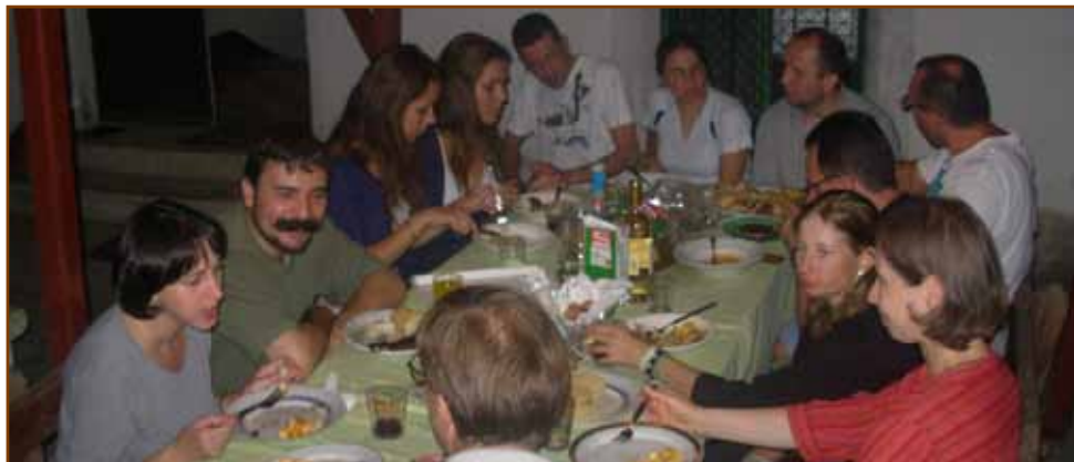
Évkezdő grillezés a HIFI-ekkel