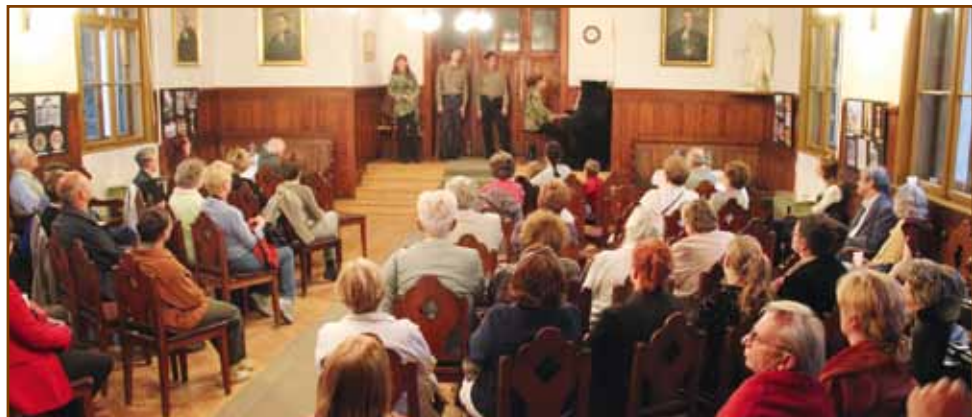
A My Friends vokál