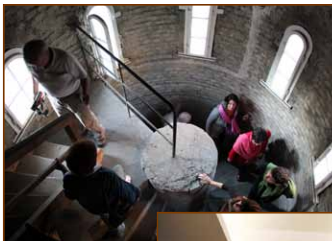
Kalandtúra a toronyban