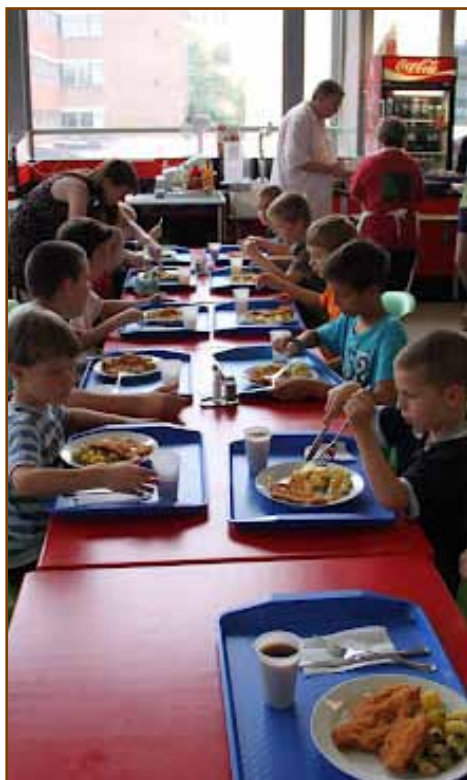
De finom ez a rántott hús