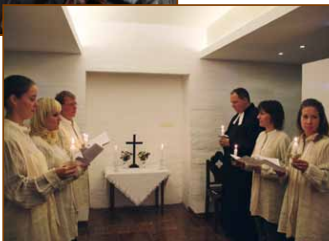
Esti imaóra az urnatemetőben