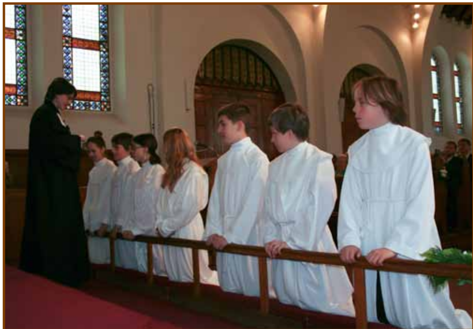
Konfirmandusok első úrvacsoravétele