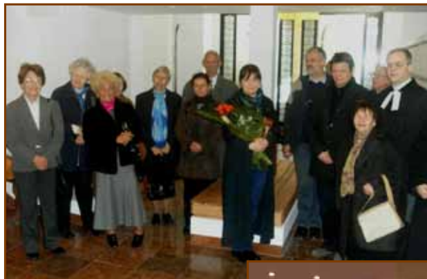
A új urnatemető átadásán