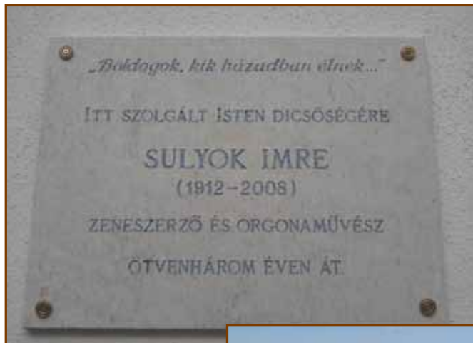
A Sulyok-emléktábla templomunk falán