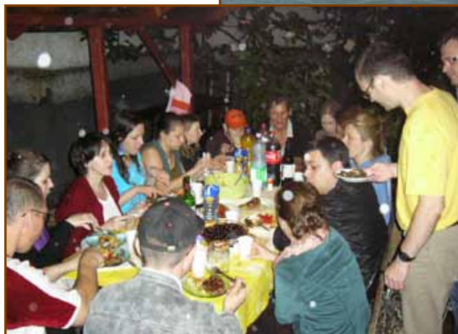
A hétfői ifi záró grillpartija zuhogó esőben