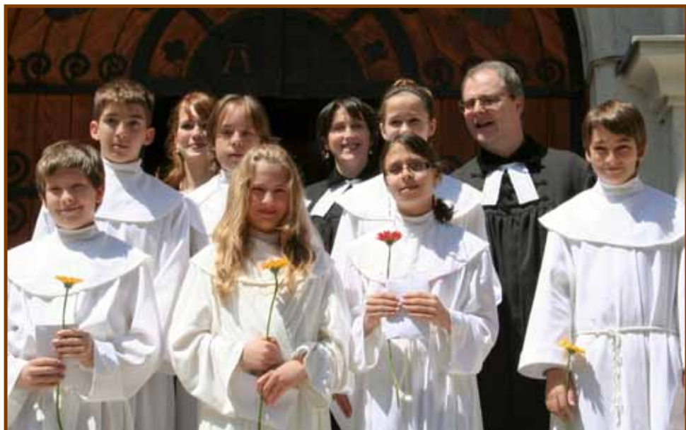
Az idei konfirmandusok