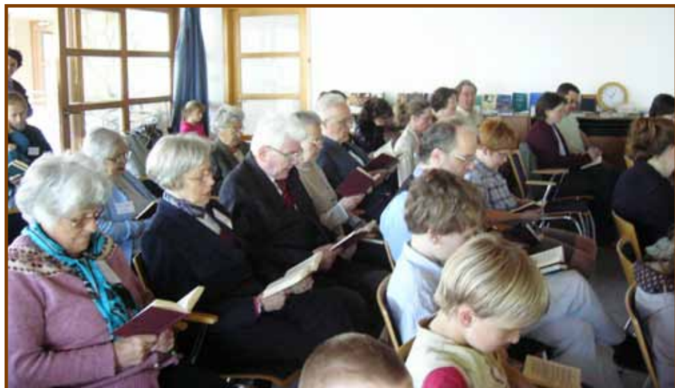
A „szárszói gyülekezet”