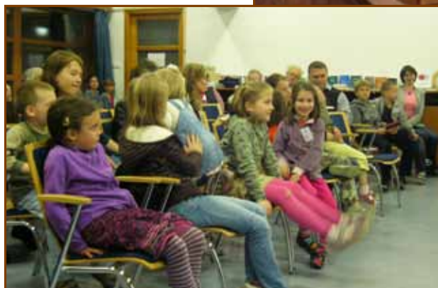
A jövő reménységei Balatonszárszón