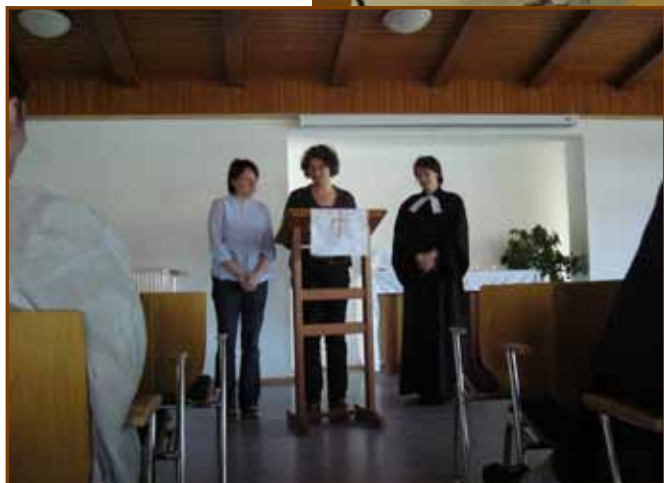
Felolvasók az istentiszteleten