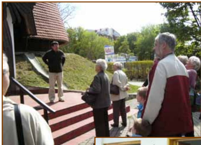
A siófoki templomnál