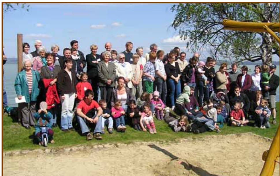
Szárszó 2012 – csoportkép